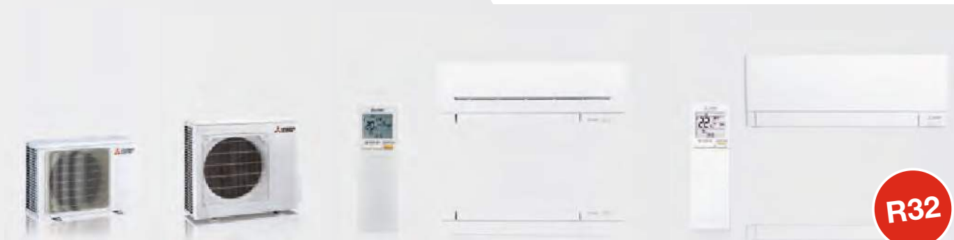
MUZ-AP20VG / AY25-42VG